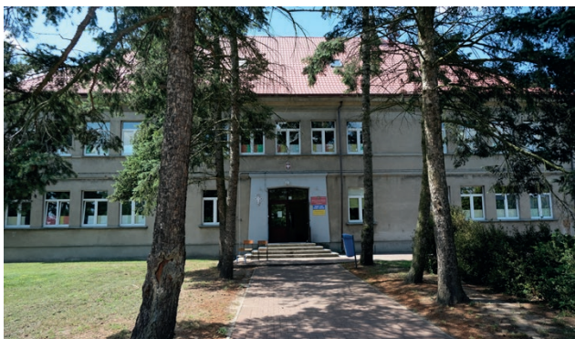
W starej szkole podstawowej powstanie żłobek i przedszkole

Pieniądze z drugiego rozdania „Polskiego Ładu” zostaną przeznaczone na dwa zadania. Wniosek nr 1 to budowa kompleksu oświatowego w Woli Podłęźnej. Docelowo ma powstać tam: żłobek, przedszkole i szkoła podstawowa. W pierwszym etapie gmina skupi się na szkole, która jest najbardziej potrzebna z uwagi na stan obiektu, w którym obecnie uczą się dzieci. Inwestycja ma objąć: opracowanie dokumentacji, rozbiórkę