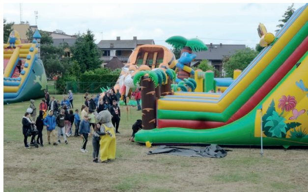
Wielkie zjeżdżalnie i duże maskotki zachęcały do zabawy