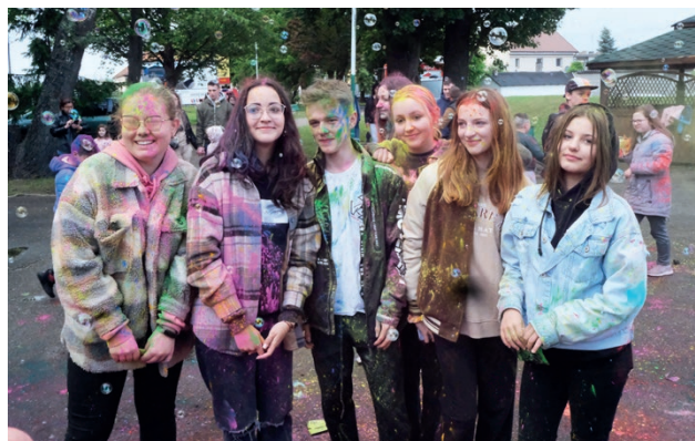
Pogoda nie przeszkodziła podczas festiwalu kolorowych proszków i baniek mydlanych

Impreza została zorganizowana z inicjatywy Stowarzyszenia Na Rzecz Rozwoju Kultury w Gminie Kramask we współpracy z Gminnym Ośrodkiem Kultury w Kramsku i Centrum Usług Społecznych w Kramsku.