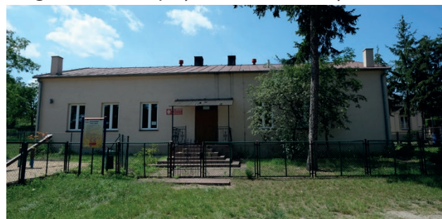
Budynek szkoły zostanie rozebrany

Łącznie z „Polskiego Ładu” w ramach drugiego rozdania gminie Kramsk przyznano 9 mln 972 tys. zł.