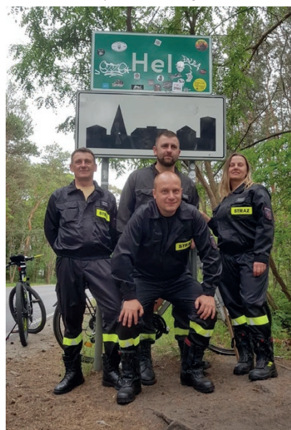
Strażacy z OSP Patrzyków-Święte zabezpieczali drogę z Kalisza aż na sam Hel

Na co choruje Jagódka? SMA1 czyli najcięższa postać choroby, która powoli zmienia życie dziecka w koszmar! – Moja córeczka słabnie z dnia na dzień, potrzebuje pomocy, która wyceniona jest na ponad 9 milionów złotych! Jest tylko jedna terapia, która pozwala rozprawić się z SMA raz na zawsze. Nieziemsko