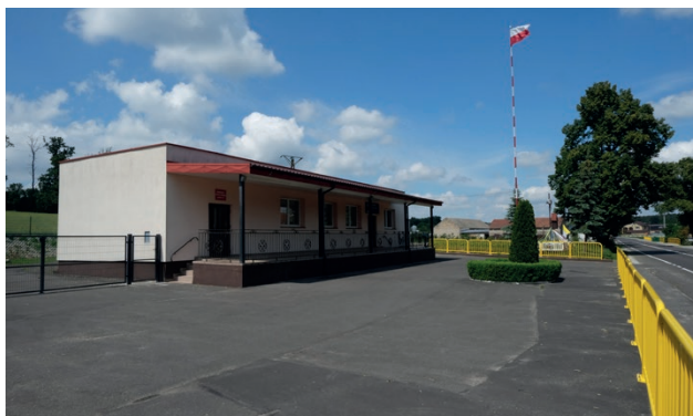
Jedyny w Polsce – Sołecki Dom Kultury stoi właśnie w Izabelinie