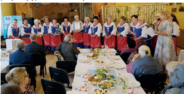
Uroczystość z okazji 65-lecia KGW Rudzica odbyła się w remizie