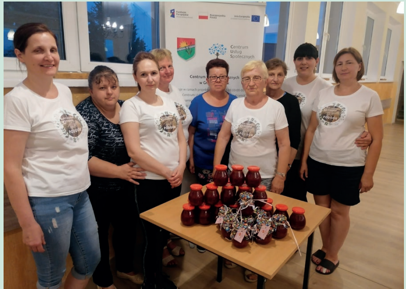
Gospodynie z Podgora podzieliły się swoimi dżemami

Warsztaty w Wysokiem były wspaniałą okazją do spędzenia czasu w ciekawy i wartościowy sposób, a także ważnym ogniwem łączącym lokalną społeczność. Gotowe przetwory zostały dostarczone osobiście przez panie z KGW do seniorów mieszkających w sołectwie Podgór.