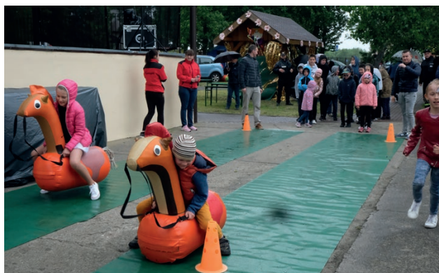
Do zabawnych rywalizacji zachęcała grupa Fantazja