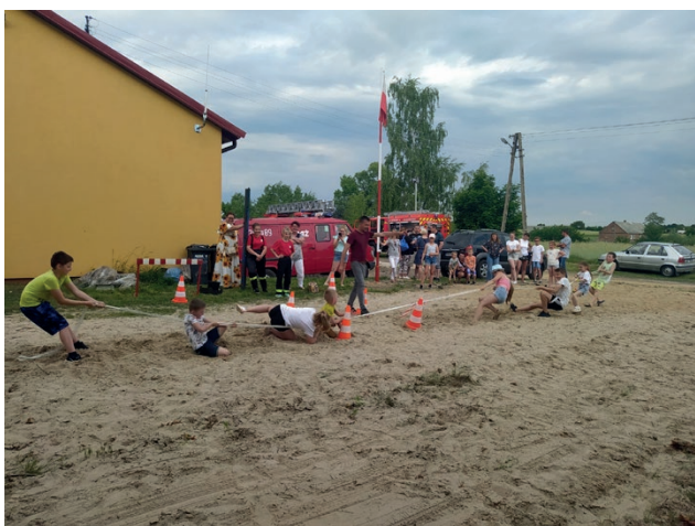
Najmłodsi chętnie uczestniczyli w zabawach i konkursach

Podczas festynu w Pąchowie nie zabrakło muzyki, jedzenia i dobrej zabawy, były konkursy, a Ochotnicza Straż Pożarna z Helenowa Drugiego zaprezentowała swój sprzęt oraz poprowadziła różne pokazy z dziedziny pierwszej pomocy oraz ratownictwa wysokościowego, policjanci z Konina natomiast pokazali najmłodszym jak wygląda ich praca, szkolili też z zasad bezpieczeństwa na drodze. Imprezę odwiedzili członkowie grupy motoryzacyjnej z Krzymowa wraz ze swoimi militarnymi autami. Ogromny wkład pracy włożyły także panie z Koła Gospodyń Wiejskich w Pąchowie.