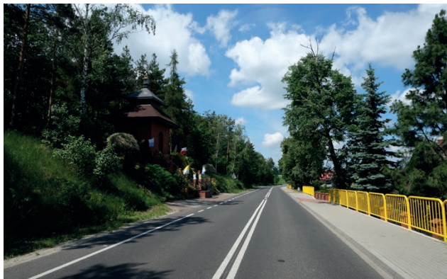
Odnowiona w ostatnim czasie droga powiatowa przebiegająca przez Izabelin bardzo poprawiła bezpieczeństwo