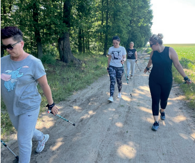
Mieszkańcy Rudzicy przeszli profesjonalny trening

Chęć organizowania w swoim sołectwie spacerów z kijkami zgłosiły już: Rudzica, Święte i Grąblin. Mieszkańcy każdego z sołectw mają zapewnione kijki oraz profesjonalny instruktarz. Pierwszy spacer zaliczyły już