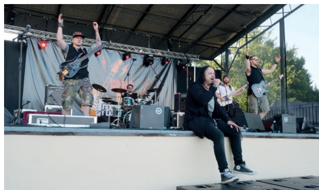
Najlepszy zespół - warszawski Klangor