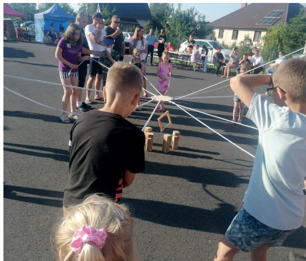
Pogoda, publiczność i goście dopisali!