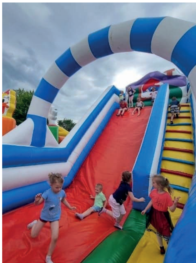
Nie brakowało chętnych do zabawy na dmuchańcach