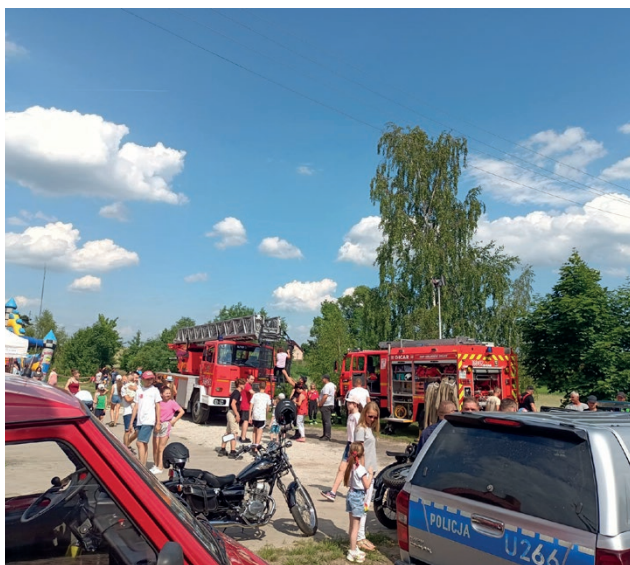
Atrakcje zapewniali między innymi: policjanci, strażacy i fani motoryzacji