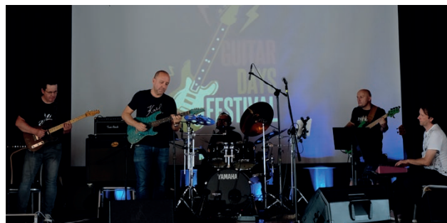
Mistrz gitary dał też koncert na zakończenie festiwalu